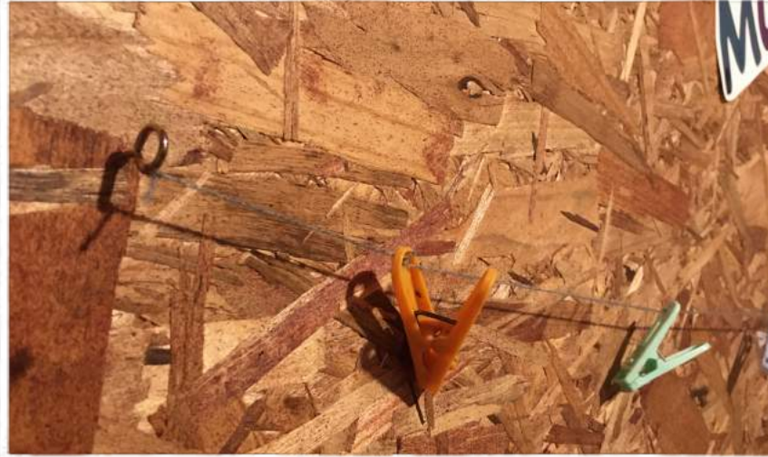
Cáncamo, lana y pinzas de ropa instalados

Instalar el método por el cual se colgarán, pegarán las palabras. En este caso se utilizaron cáncamos en la pared, a los que se les amarró una lana, y en ella se amarraron pinzas de ropa. (Dependiendo de lo que se necesite o tenga a disposición, se puede usar velcro para tener tarjetas removibles, se pueden usar sobres, pinzas de ropa adheridas a la pared, entre otras opciones.)