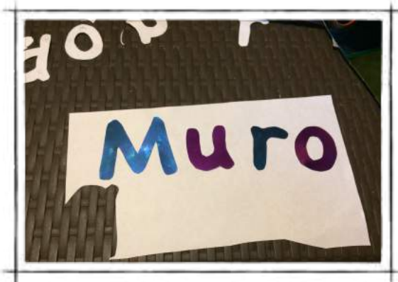
Algunas letras recortadas

Recortar las letras previamente marcadas en la cartulina. Ubicarlas directamente en el muro donde se pondrán, o sobre un papel o cartulina que sirva de fondo. Pegar las letras con pegamento en barra si es a un papel o cartulina, y si es a la pared, puede utilizarse cinta de doble cara.