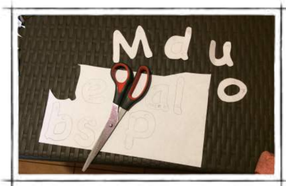
Moldes en papel

Para realizar las letras en la cartulina metálica, primero se genera un molde de las letras. Se escriben en papel blanco. Luego se recortan. Y una vez listo el molde se traspasan a la cartulina metálica. Lo cual se realiza por la parte de atrás para ver mejor al recortar. OJO; se debe tener cuidado y traspasar las letras al revés, para que al recortarlas queden al derecho en la cartulina. (Si no se necesita de molde, tan solo escriba directamente en una cartulina)