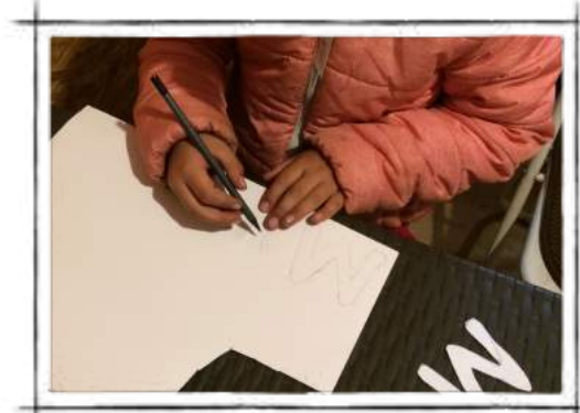
Traspaso en cartulina