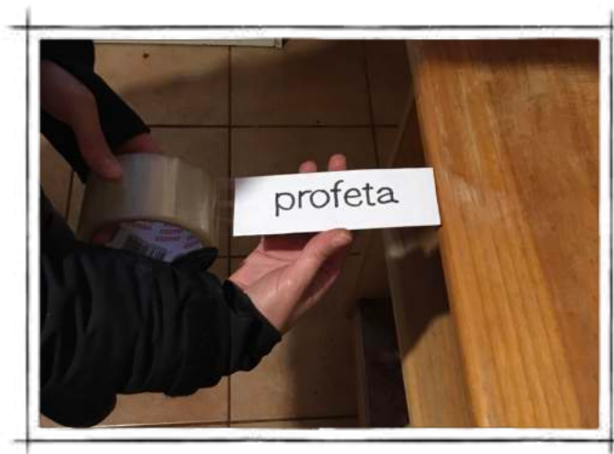
Protegiendo la tarjeta