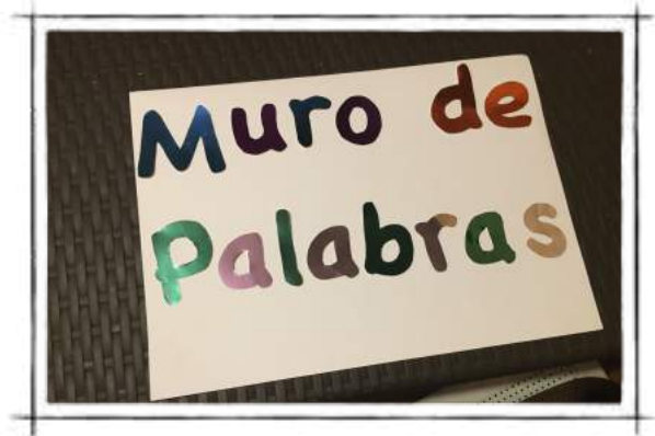
Decidiendo cómo ponerlas